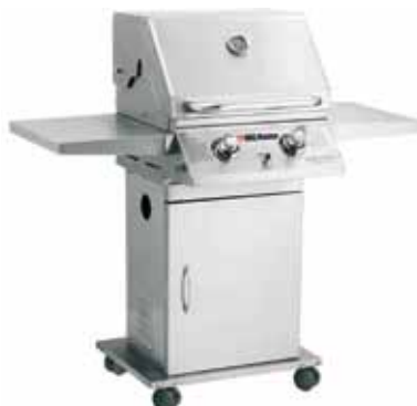
BBQ Master S Luxury