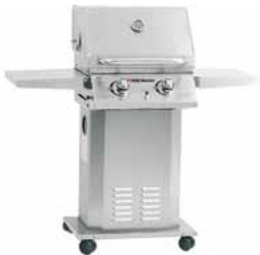
BBQ Master S Edelstahl